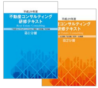
表紙はイメージです