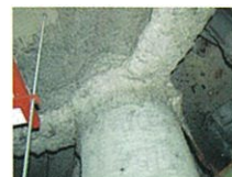
吹付けアスベスト (鉄骨材の耐火被覆)

建築基準法において規制対象とする吹付石綿等が施工されているおそれのある建築物に対しては、地方公共団体が調査および除去等の費用の一部を補助している場合があるので、お近くの地方公共団体にご相談ください。