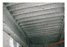
アスベスト含有吹付け ロックウール (鉄骨材の耐火被覆)